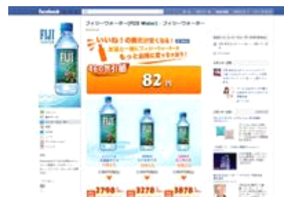
キャンペーンページ「いいね！」を押す前